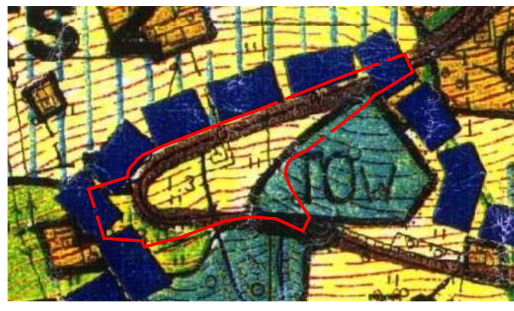
WYRYS ZE STUDIUM SKALA 1:5 000 GRANICA OBSZARU OBJĘTEGO ZMIANĄ PLANU